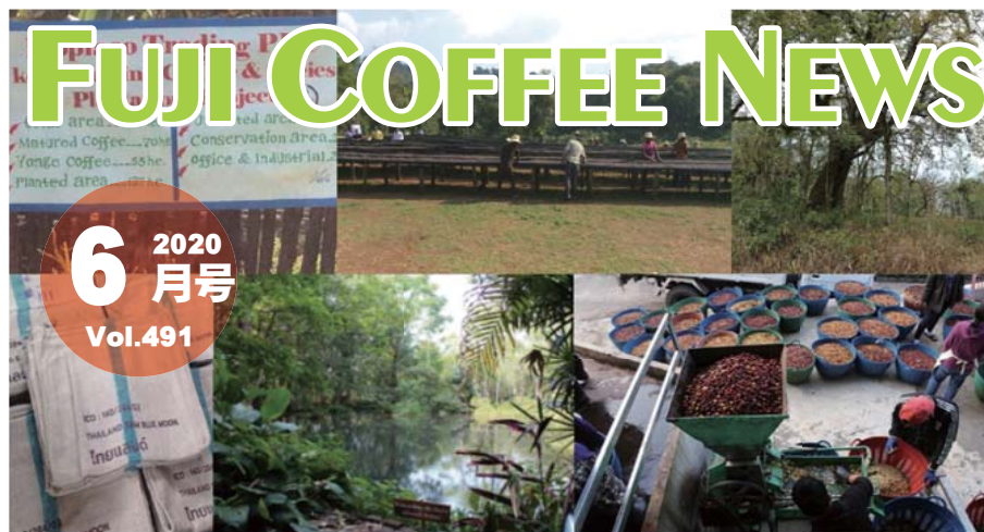
エチオピア シェカ カヨカミーノ農園風景 (左右・中央) タイ ブツダが一晩泊まったとされる泉 (中央) : アカ族、リソー族コーヒー豆の精選風景 (右)