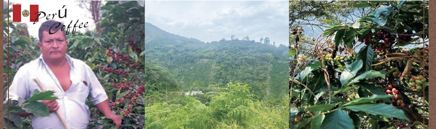
ペルー共和国 農園主(左) 農園風景(中央) (右)