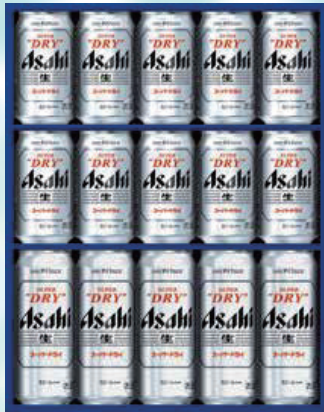
424 アサヒ AS-4G 4,840円 (本体4,400円) スーパードライ350ml缶×10/ スーパードライ500ml缶×5