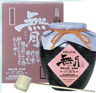
453 櫻の郷 無月麴 6,380円 (本体5,800円) 芋焼酎 1.8L×1本