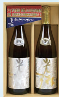
450 【直送】千代菊 光琳 CKYJ 7,150円 (本体6,500円)