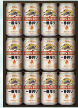
445 キリン K-IBI 3,740円 (本体3,400円) 一番搾り350ml缶×12