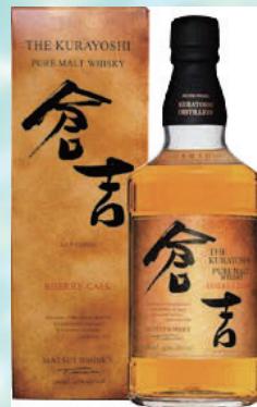
455 マツイウイスキー 倉吉シェリーカスク 4,840円 (本体4,400円) 倉吉シェリーカスク 700ml×1