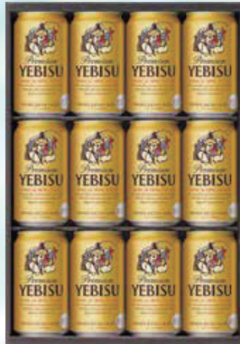
447 サッポロ YE-3D 3,740円 (本体3,400円) エビスビール350ml缶×12